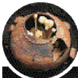
◀ 墓に入れられた人骨の様子

周囲の景観に溶け込んだ資料館となっています。吉胡貝塚の人々の暮らしを模型、写真、出土品で分かりやすく説明します。