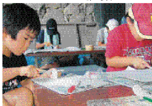
▼ 体験学習 まが玉づくり

中でも、吉胡貝塚の特徴である、埋葬された人骨や貝塚にスポットを当てています。また、さまざまな体験をすることが出来る「体験学習教室」も用意しています。