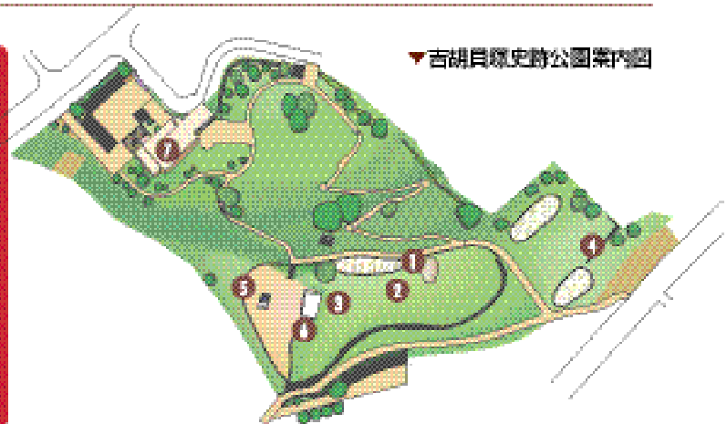
▼吉胡貝塚史跡公園案内図