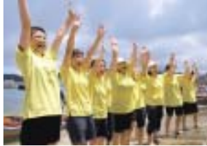
結果に大満足の選手の皆さん

このレースは、石垣市八重山地方の伝統船を使い、漕ぎ手10名・かじ取り1名の計11名で約500mのコースを競争するものです。皆さんは、練習以上の力が出せた「みんなの呼吸がびつたり合った」と、うれしそうに話してくれました。