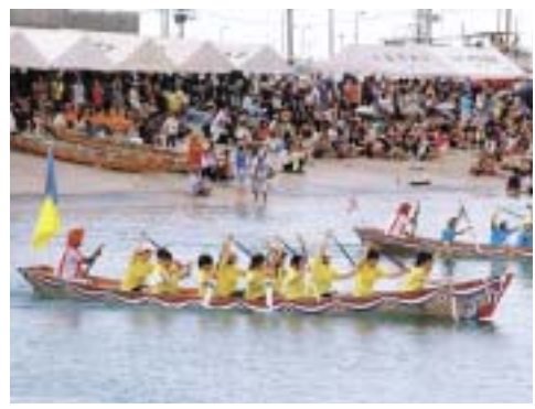
力いっぱいオールをこぎスタート

6月18日(月)、沖縄県石垣市で行われた「マドンナハーリーレース」に参加した田原市の女性チームが、出場31チーム中10位と大健闘しました。