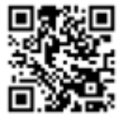
携帯サイト QRコード

【あいちAEDマップ】 http://aed.maps.pref.aichi.jp/ 【あいちAEDマップ携帯サイト】 http://aed.maps.pref.aichi.jp/k/