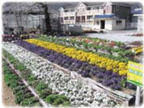
花の会(大久保B)の花壇