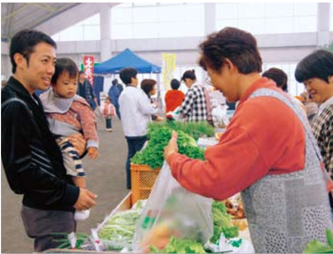
▲新鮮で格安の野菜を前に、来場者もニコリ

サンテパルクたはらで、 秋の収穫祭 が開催されました。愛知みなみ農業協同組合や地元農家などにより設置された22の仮設売店には、渥美半島の農産物などがずらり。各種即売のほか、ビンゴ大会なども行われ、約3000名の来場者でにぎわいました。