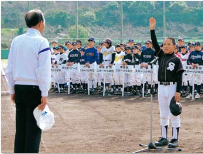
▲大会への意気込みと、夢の架け橋への思いを込めて選手宣誓

11月23日(祝)～24日(振)の2日間、 第3回田原市長杯少年野球交流大会 が開催されました。この大会は、伊勢湾口道路計画の促進に向けて続けられているもので、今年も田原市から12チーム、伊勢・志摩地域から16チームが参加し、熱戦を繰り広げました。