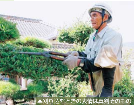
▲刈り込むときの表情は真剣そのもの