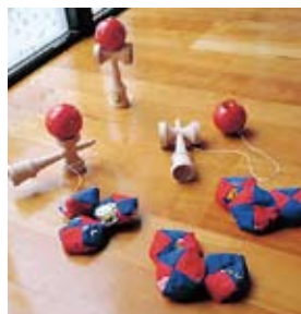
▲昔の遊びを楽しもう!