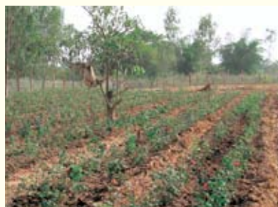
栽培が開始されたバラ農園。数か月後には初めての花摘みが予定されています

日本のように設備が整っているわけでもなく、気候には雨季があるなど、田原市とは環境がずいぶん異なるラオス。バラを育てるのは、容易ではないそうです。しかし、帰国した研修生の皆さんは、田原市で学んだことをラオス流にアレンジしながら、バラ栽培の継続・発展を目指しています。