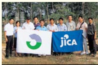
ラオスのバラ農園に田原市の市章を掲げる農業研修生と関係者の皆さん

田原市では、 ジャイカ JICA(国際協力機構)から「草の根技術協力事業」の委託を受け、これまで平成19年・20年に2名ずつ、ラオスの農業研修生を受け入れてきました。研修生の皆さんは、ラオスでのバラ栽培実現を目指し、日本の農業を学んできました。そして事業開始から2年、ついにラオスでのバラ栽培が開始されました。