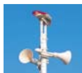
▲海岸付近にあるスピーカーと赤色回転灯

田原市では、津波注意報・警報が発表されると、市内一斉放送が自動的に流れます。海岸付近にあるスピーカーは、目で見てもわかるように、赤色回転灯が光ってお知らせします。放送が聞こえたり、回転灯が光っているのが見えたりしたら、注意してください。