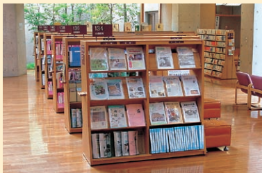
▲地域資料コーナー(中央図書館)