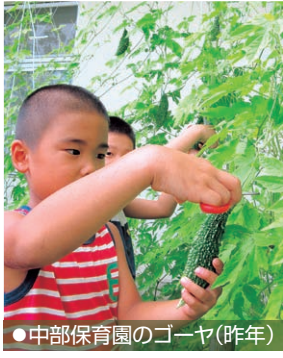
●中部保育園のゴーヤ(昨年)

緑のカーテンは、窓から入り込む日差しをさえぎり、葉の蒸散作用で熱がうばわれるため、カーテンの外側との温度差は約2〜3℃にもなります。緑のカーテンに向いているのは、夏の間はよく茂り、秋になると枯れるゴーヤやアサガオ、ヘチマ、ヒヨウタンなどのつる性植物です。皆さんも今年の夏は、緑のカーテンで涼しい夏を過ごしてみませんか。