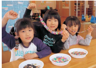
▲1分間に何個通せるかな?