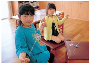
▲ぶんぶんに回してみよう!