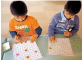
▲誰が一番早く、並べられるかな?