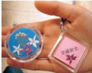
▲お花のかわいいキーホルダーに!