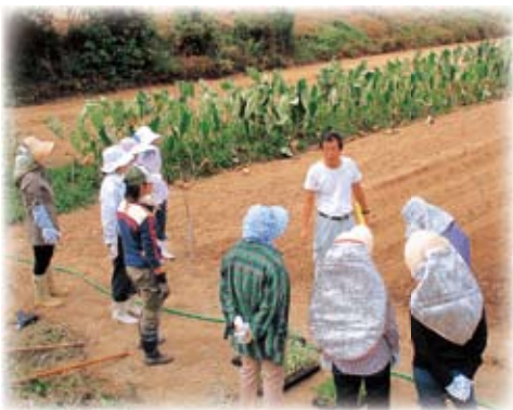
▲昨年度の様子（活き活き農業セミナー）

🌐http://www.city.tahara.aichi.jp/ section/einou/