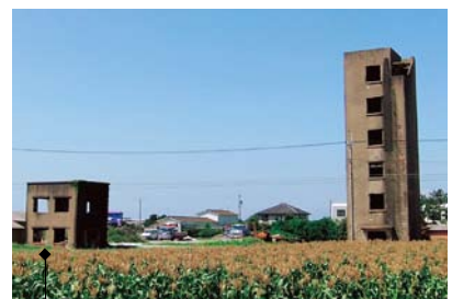
◆気象塔兼展望塔(写真右)

高さ約7mのコンクリート造二階建の建造物で、点在する観測所や監視所との連絡を行っていました。