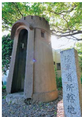
●警戒哨舎と境界石柱(移設)

伊良湖射場跡には、気象塔兼展望塔(通称・六階建)や無線電信所、油脂庫、警戒哨舎などの戦争遺跡があり、昔の面影を見ることができます。現在では、個人が所有する農機具庫などとして残されています。