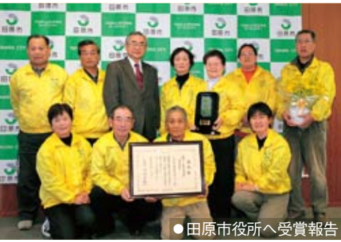
●田原市役所へ受賞報告

今回の表彰では、遊休農地に菜の花を植え、美しい農村景観を作り出すだけでなく、搾油用菜の花から菜種油「たはらっこ」を生産販