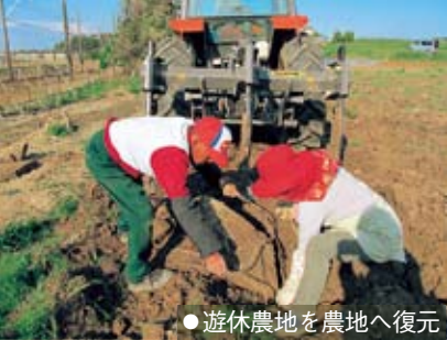
●遊休農地を農地へ復元