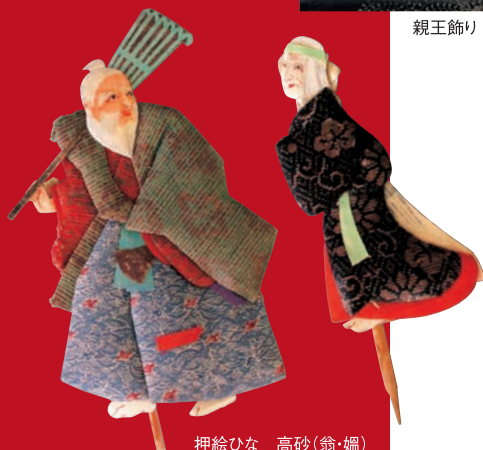
押絵ひな 高砂(翁・媼)