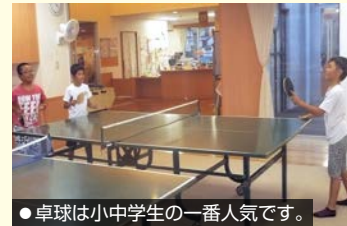
●卓球は小中学生の一番人気です。