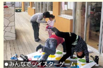
●みんなでツイスターゲーム