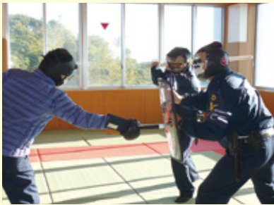
▲能力向上のため逮捕術の訓練に励む署員

今後も、署員が一丸となって訓練に励み、士気を高め、市民の「安全・安心」のため、まい進していきますので、皆様のご理解とご協力をお願いします。