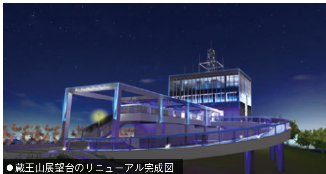
●蔵王山展望台のリニューアル完成図