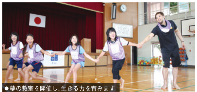
●夢の教室を開催し、生きる力を育みます