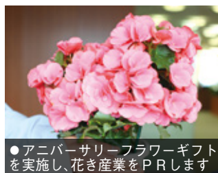
●アニバーサリーフラワーギフトを実施し、花き産業をPRします