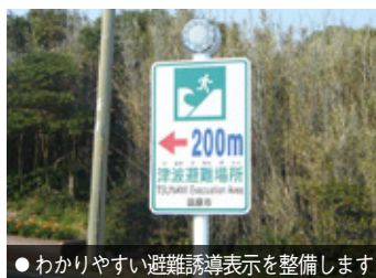
●わかりやすい避難誘導表示を整備します